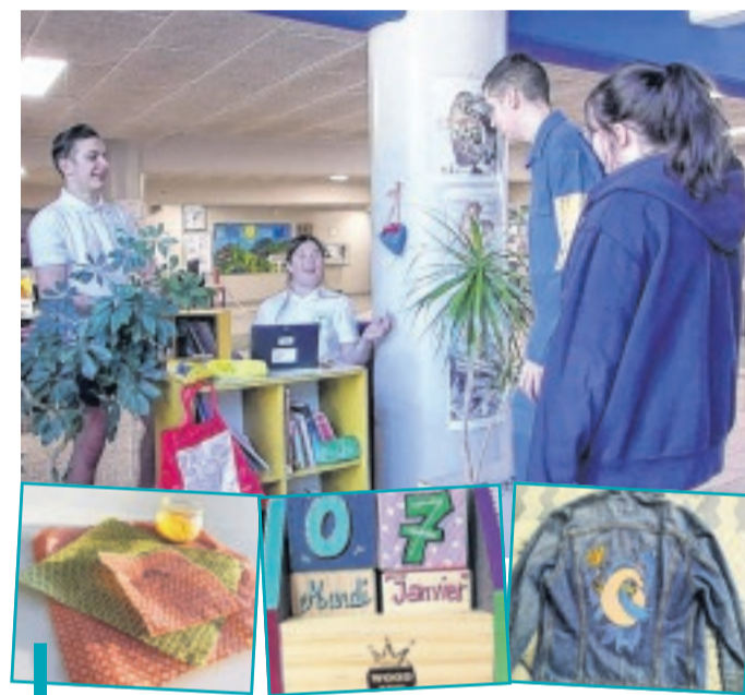
Produits bios, récupération, recyclage... Les mini-entrepreneurs fabriquent des objets qui suivent les thématiques sociétales.

C'est cette association, créée en 2013 et dont la mission est de "créer des passerelles entre le