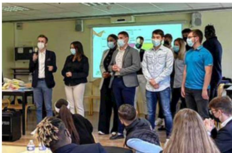
Les étudiants ont planché une journée sur le thème « Comment bien vieillir en Champagne-Ardenne ? ».