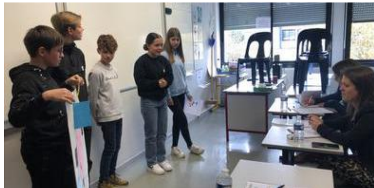
Le projet des « confs fun » a été élu coup de cœur de ce jury.