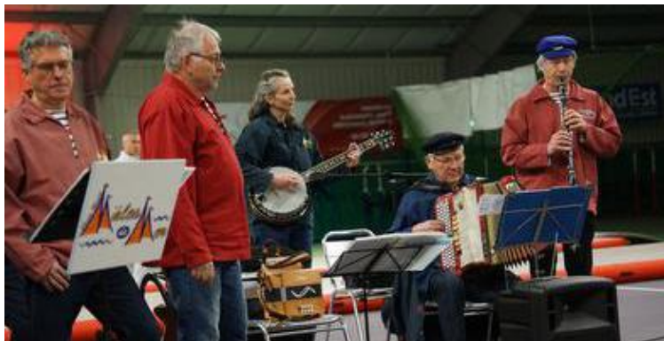
Les Mâles de mer chanteront pour le Burkina.

Pour financer ces projets, différentes actions sont menées dont une rencontre annuelle de chorales. C'est